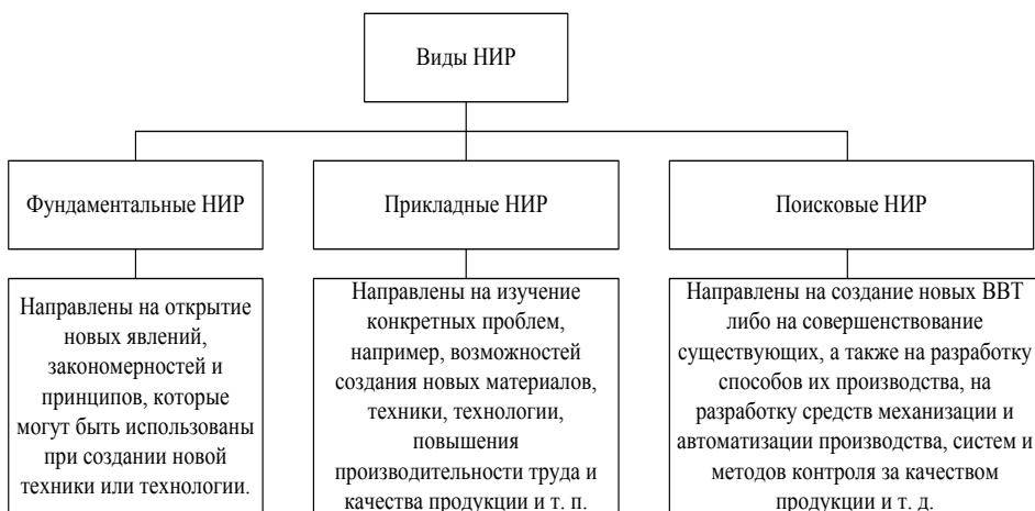
Рисунок 1. Виды НИР и их направления исследований

Результаты фундаментальных исследований, как правило, служат основой для проведения поисковых и прикладных исследований при создании новых видов изделий, материалов, средств и способов производства.